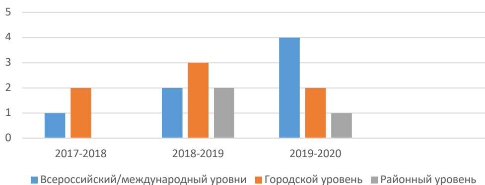
Участие педагогов ДДТ в профессиональных конкурсах за последние 3 года

Количественный показатель участия сотрудников в конкурсах профессионального мастерства в последнее время вырос. Увеличилось число участников всероссийского и городского уровней.