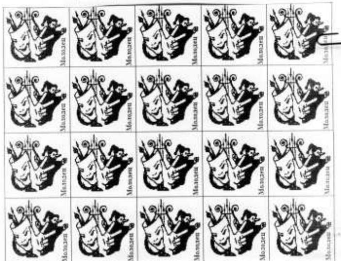
Пример орденов с ключевым словом

Подведение итогов происходит в конце каждого полугодия. Чтобы не было путаницы каждое полугодие на ордине изменяется ключевое слово.