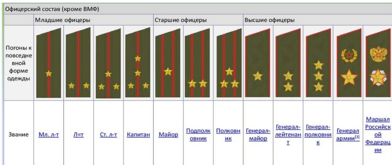
Рис.1 погоны офицерского состава сухопутных войск Российской Федерации

Из общей кучи всевозможных погонов команде нужно будет выбрать и разложить погоны офицерского состава сухопутных войск Российской Федерации по старшинству и подобрать к каждому погону войсковое воинское звание (справочный материал - рис.1). Максимальное количество баллов - 5. Одна ошибка (неправильно названное, либо неправильно расположенное по старшинству звание) - минус 1 балл. Если команда допускает 5 и более ошибок, то ей присуждается 0 баллов. КВ - 5 минут.